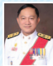
พลตำรวจเอก อดุลย์ แสงสิงแก้ว รัฐมนตรีว่าการกระทรวงการพัฒนาสังคม และความมั่นคงของมนุษย์ รองประธานกรรมการคนที่ ๓