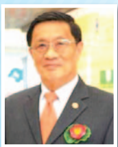
พลอากาศเอก วีรวิท คงศักดิ์