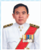
นายวีระ โรจน์พจนรัตน์ รัฐมนตรีว่าการกระทรวงวัฒนธรรม รองประธานกรรมการคนที่ ๑