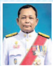
พลเอก ดาวพงษ์ รัตนสุวรรณ รัฐมนตรีว่าการกระทรวงศึกษาธิการ รองประธานกรรมการคนที่ ๒