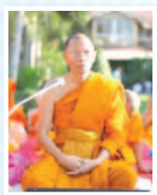
พระพรหมติลก (เอื่อน ทาสรมโม) วัดสามพระยา