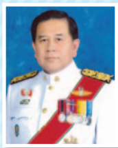
พลเอก ณะศักดิ์ ปิฎิมาประกร รองนายกรัฐมนตรี ที่ได้รับมอบหมายจากนายกรัฐมนตรี ประธานกรรมการส่งเสริมคุณธรรมแห่งชาติ