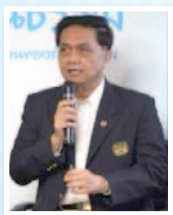
พลเอก ศรุต นาควัชระ