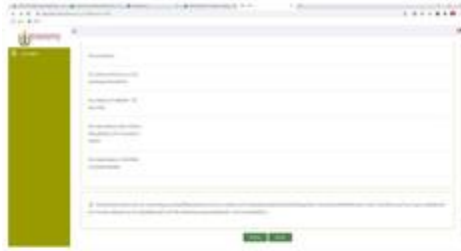
ระบบจะปรากฏหน้าต่างดังนี้